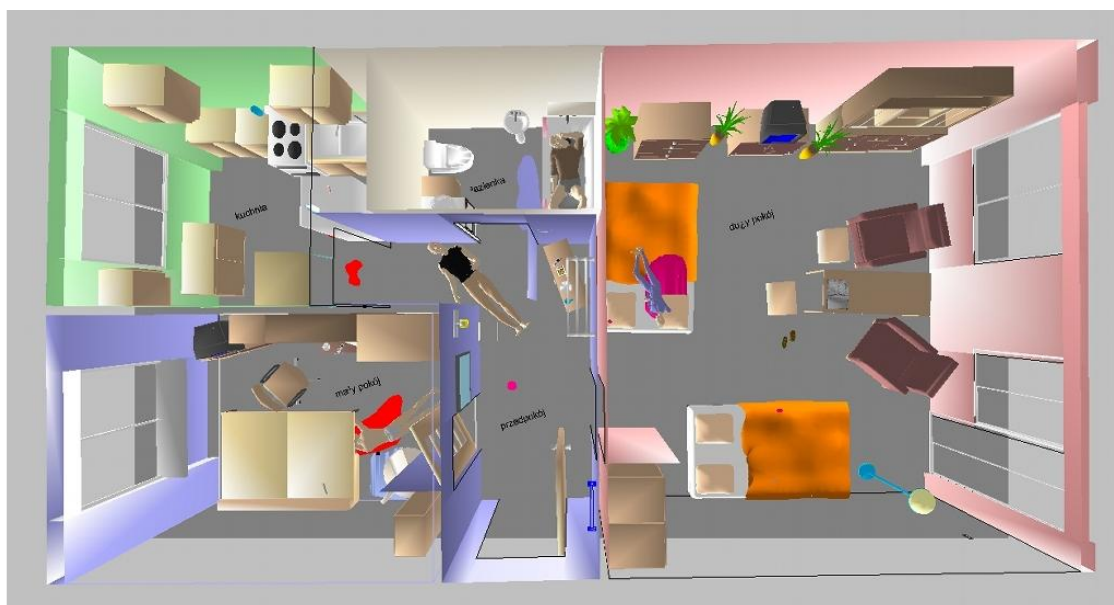
Ryc. 8. Mieszkanie poddane oględzinom w rzucie 3D.

pomieszczenia mieszkalne. W ten sposób uzyskano pełen obraz miejsca poddanego oględzinom.