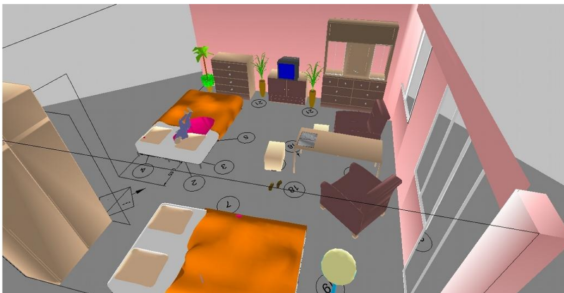
Ryc. 7. Duży pokój w rzucie 3D.

Po wykonaniu wizualizacji wszystkich pomieszczeń w sposób, jaki przedstawiono na ryc. 6 i 7 w programie Crash/Crime Zone połączono wszystkie