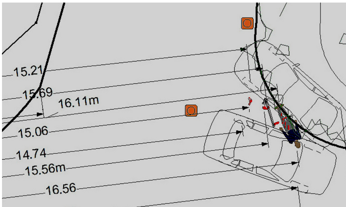
Ryc. 4. Fragment szkicu z naniesionymi wymiarami.