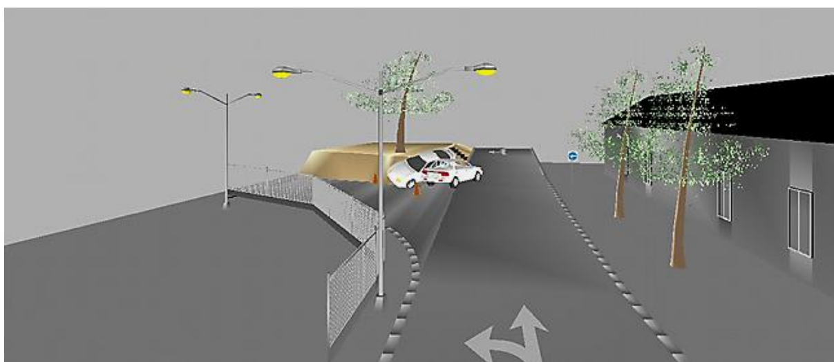
Ryc. 5. Widok miejsca wypadku drogowego w rzucie 3D.

Mając tak wykonany szkic miejsca zdarzenia drogowego, na którym występują łuki, wzniesienia, czy też rozbudowana infrastruktura drogowa policjant może stworzyć bazę takich miejsc i korzystać z niej podczas kolejnych zdarzeń, gdzie na gotowy szkic naniesie samą sytuację na drodze nie tracąc czasu na pomiary samej drogi.