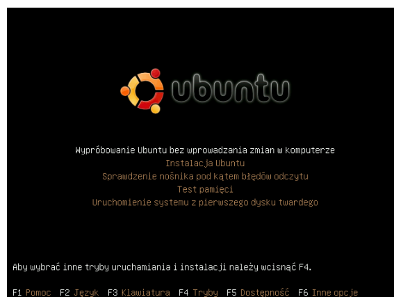
Ryc 1. Ekran instalacyjny.

Jak widać na załączonym obrazie ekranu instalacyjnego nawet osoba kompletnie niezaznajomiona z tematem potrafiłaby wybrać interesującą ją opcję. Oczywiście nie musimy instalować, możemy wypróbować, bez żadnych konsekwencji.