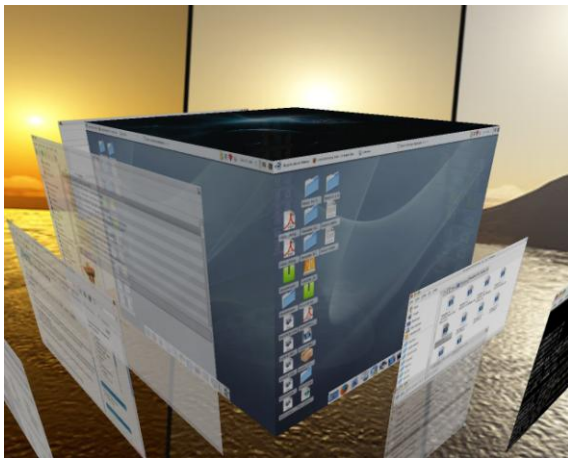
Ryc. 3. Interfejs w odmianie BERYL.

Ciekawostką może być zastosowanie w systemie Windows interfejsu graficznego 3D, oczywiście w droższych dystrybucjach Visty, otóż w przypadku Linuxa, środowisko to znane jest od wielu lat, występuje w dwóch odmianach: BERYL i COMPIZ